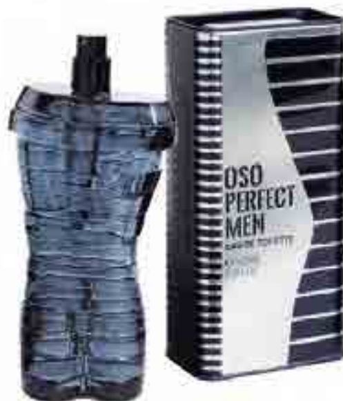
Oso Perfect Men Eau de toilette 100 ml