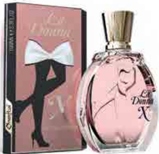
La Donna X Eau de parfum 100 ml