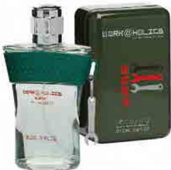
Work&Holics Base Eau de toilette 100 ml